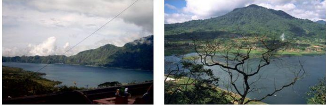
Ida mepesanan Dewi Danuh